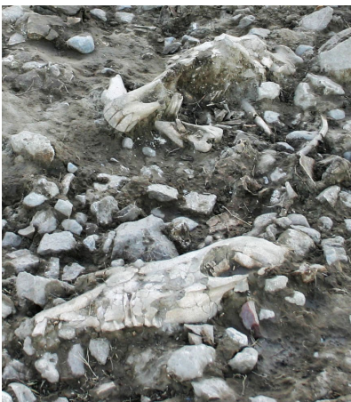
Crânes de chevaux, fouille de Pech Maho (Aude).